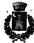
Comune di Cefalà Diana