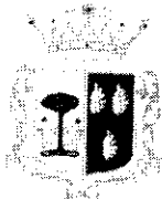
Comune di Marineo