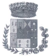
Comune di Bolognetta