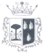
Comune di Marineo