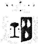
Comune di Marineo