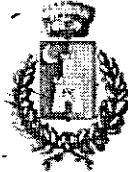
Comune di Cefalà Diana