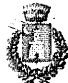
Comune di Cefalà Diana