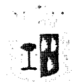
Comune di Marineo