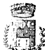
Comune di Bolognetta