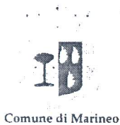
Comune di Marineo