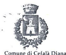
Comune di Cefalà Diana