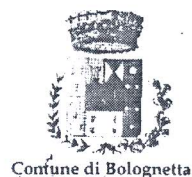
Confine di Bolognetta