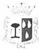
Comune di Marineo