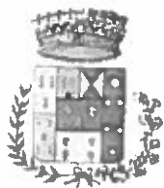
Comune di Bolognetta