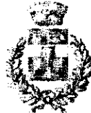
Comune di Godrano