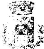
Comune di Bologneta