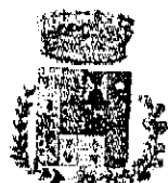
Comune di Bologneta