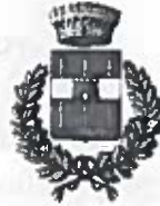
Comune di Godrano