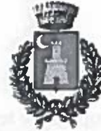
Comune di Cefalà Diana