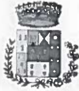
Comune di Bolognetta